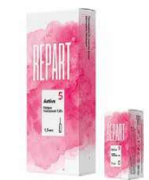
Бимодальный биоревитализант Repart® 5 Active