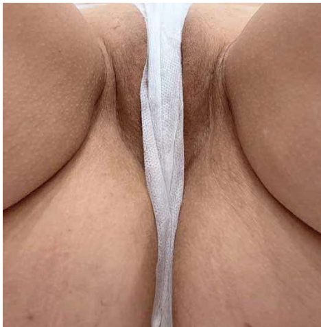
Фото 1. До